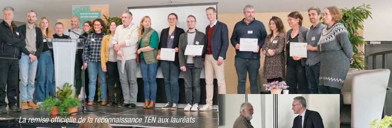
La remise officielle de la reconnaissance TEN aux lauréats

certifie la qualité des projets proposés. Démarche de progrès, mise en place d'actions opérationnelles concrètes et cohérentes avec les enjeux du territoire, transversalité de la démarche, mobilisation des acteurs locaux sont quelques-uns des critères d'évaluation des candidatures. La Ville fait partie des 62 territoires engagés pour la nature en Normandie.